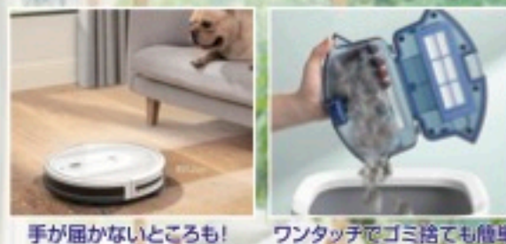
手が届かないところも！ ワンタッチでゴミ捨ても簡単

超薄型設計ながら最大 2000Pa の吸引力による掃除が可能なロボット掃除機です。硬い床の水拭き可能なモッピングモードも搭載。環境や目的に合わせてモードを使い分けることで、あなたの家の床をピカピカに保ちます。スマホのアプリ上で、掃除の開始・終了等の設定も可能。